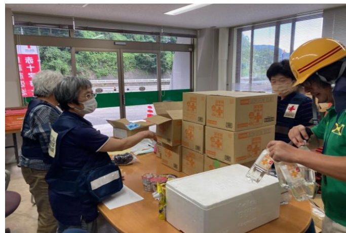
「被災者へ配付するお弁当作りや救援物資の箱詰めを行う 赤十字ボランティア(鳥取県鳥取市)」