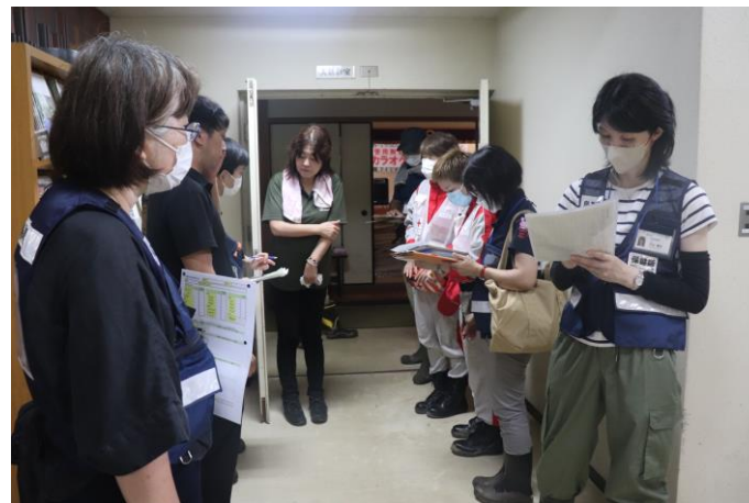
「関係機関とともに避難所を巡回する 救護班（鳥取県鳥取市）」