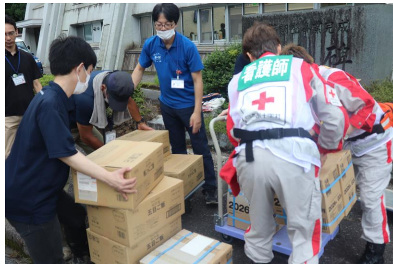
「救援物資を配布する救護班 (鳥取県鳥取市)」