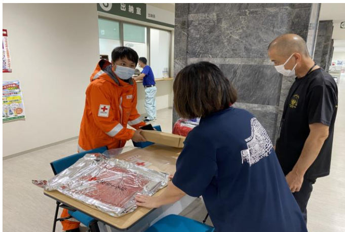
「自治体職員に救援物資の説明を行う 日赤職員（沖縄県今帰仁村）」