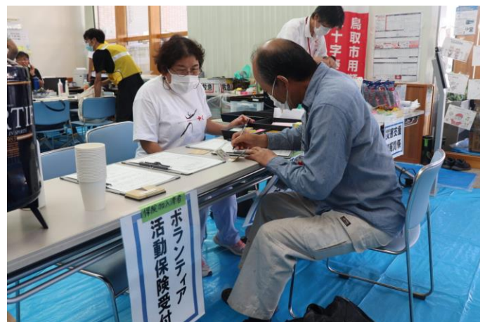
「災害ボランティアセンターの運営支援を行う赤十字ボランティア(鳥取県鳥取市)」