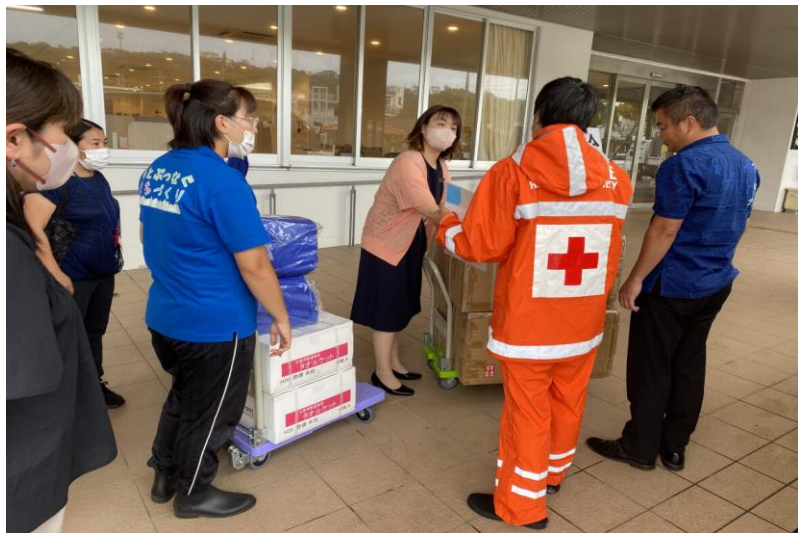
「救援物資の配布を行う日赤職員 (沖縄県本部町)」