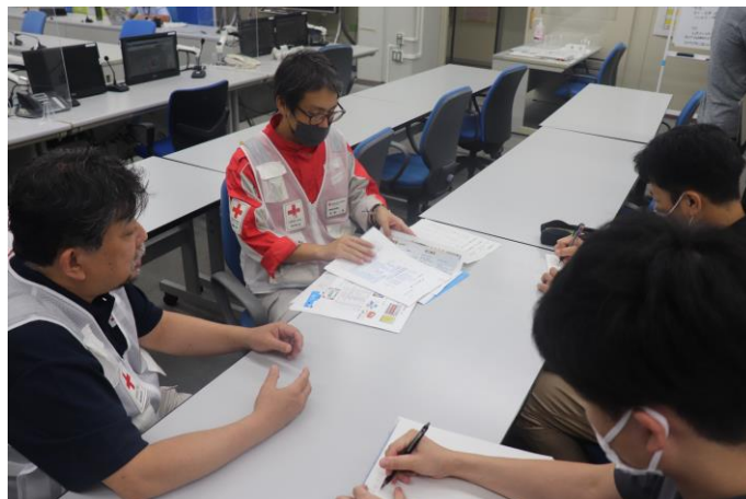
「県庁で情報収集を行う日赤災害医療 コーディネーターチーム（鳥取県鳥取市）」